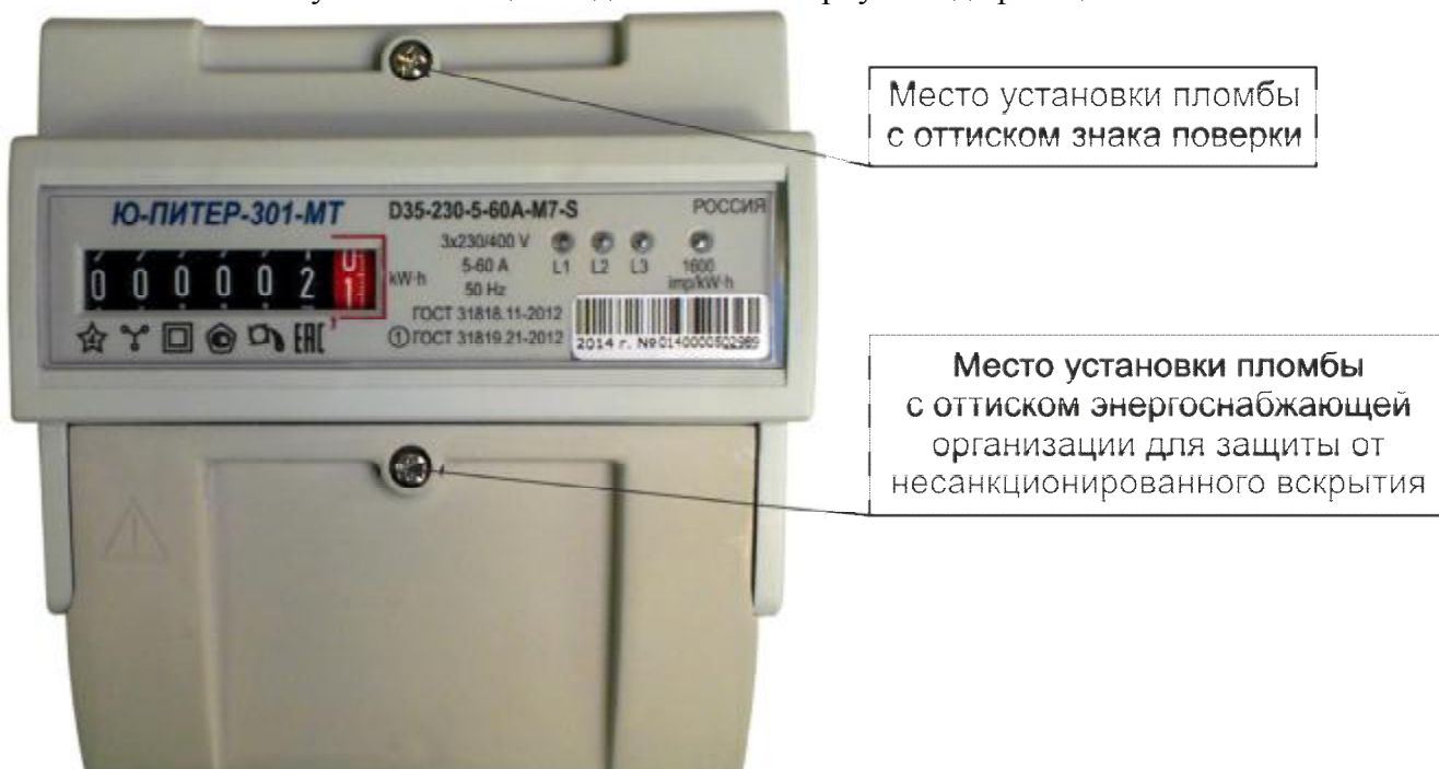
Рисунок 7 – Общий вид счетчика в корпусе модификации D35