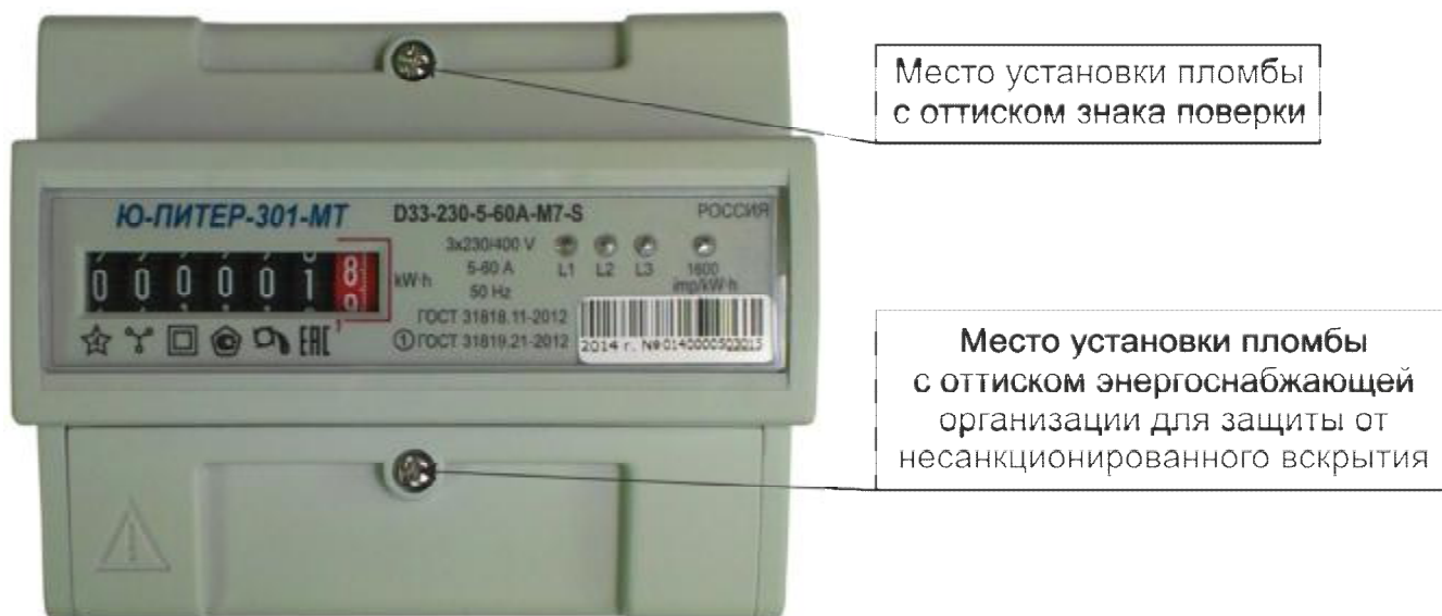
Рисунок 5 – Общий вид счетчика в корпусе модификации D33