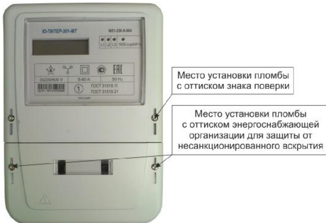
Рисунок 2 – Общий вид счетчика в корпусе модификации W31

Фотографии общего вида счётчиков, с указанием схем пломбировки от несанкционированного доступа, приведены на рисунках 2 – 8.