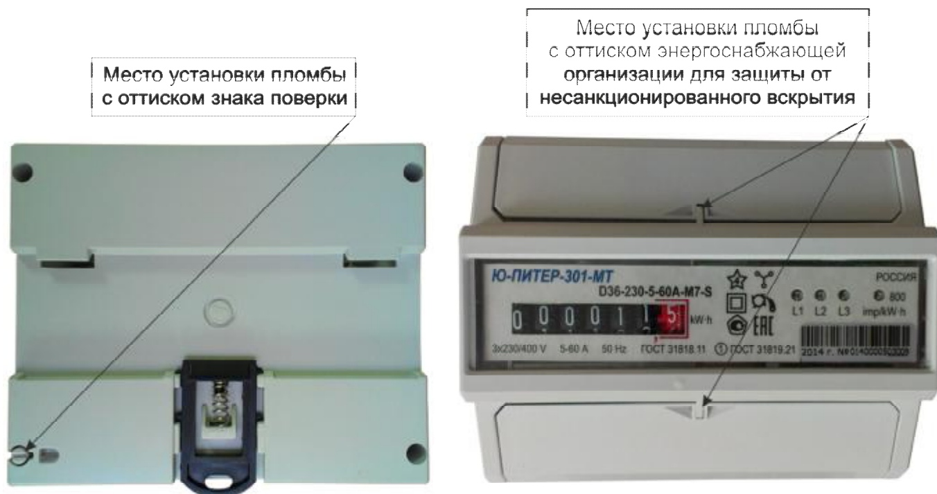
Рисунок 8 – Общий вид счетчика в корпусе модификации D36