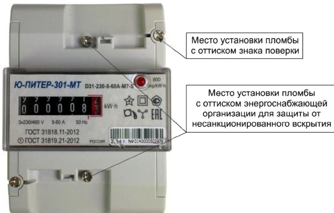
Рисунок 3 – Общий вид счетчика в корпусе модификации D31