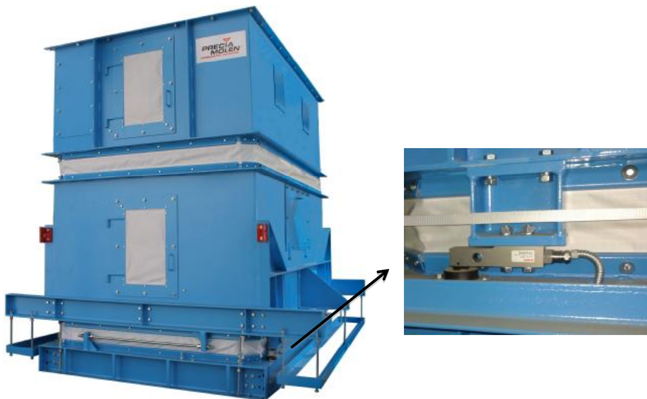
Рисунок 2 – Внешний вид весов ABS-XL (с местом установки датчика).

Принцип действия весов основан на преобразовании деформации упругих элементов датчиков, возникающей под действием силы тяжести взвешиваемого груза, в электрический сигнал, изменяющийся пропорционально массе груза. Электрические сигналы с датчиков суммируются и поступают на индикатор, где суммарный сигнал преобразуется в цифровой код и значение массы груза индицируется на цифровом табло индикатора.