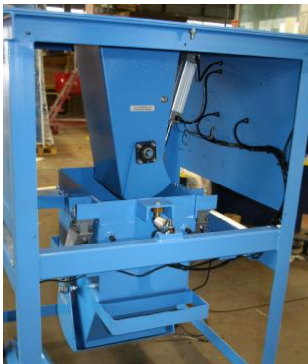
Рисунок 1 – Внешний вид весов ABS-X