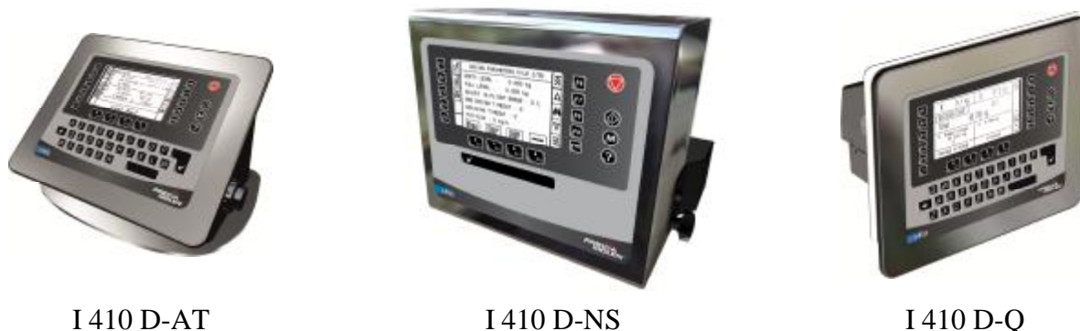
I 410 D-AT

В качестве индикатора в весах используются приборы весоизмерительные I400 фирмы «PRECIA-MOLEN», Нидерланды (Госреестр № 58867-14).