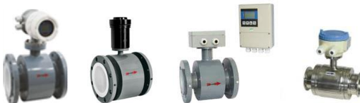
Рисунок 1 – Общий вид расходомеров-счетчиков электромагнитных «ЭНЕРГИЯ-Э»

Общий вид расходомеров-счетчиков электромагнитных «ЭНЕРГИЯ-Э» приведен на рисунке 1.