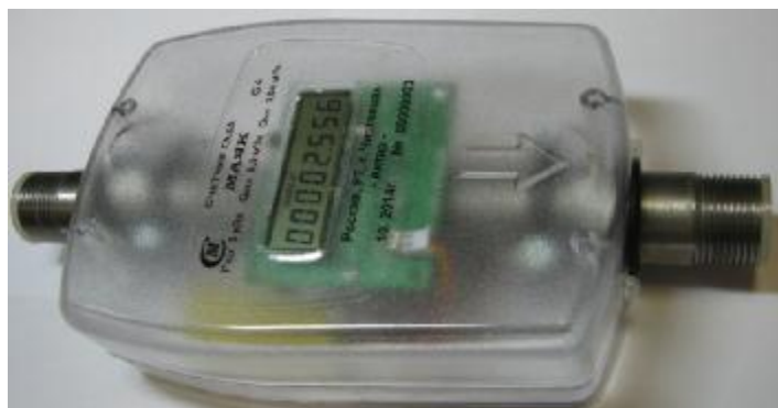
Рисунок 1 – Внешний вид счетчиков

Внешний вид и места пломбировки счетчиков приведены на рисунках 1 и 2