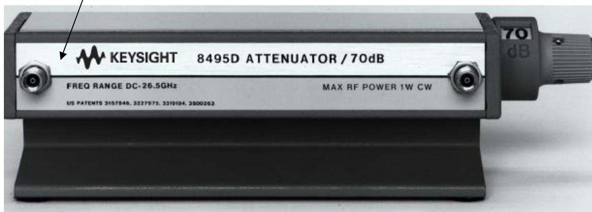
Рисунок 4 - Внешний вид аттенюаторов 8495D