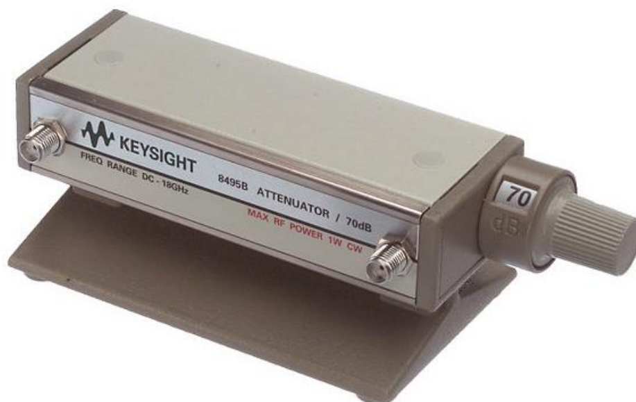
Рисунок 2 - Внешний вид аттенюаторов 8495А, 8495В