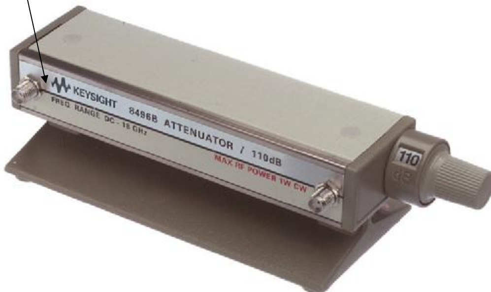
Рисунок 3 - Внешний вид аттенюаторов 8496А, 8496В