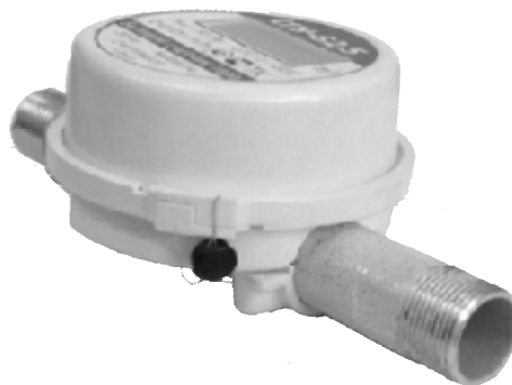
Рисунок 1 – Общий вид счетчиков

Схема пломбировки счетчиков приведена на рисунке 2.