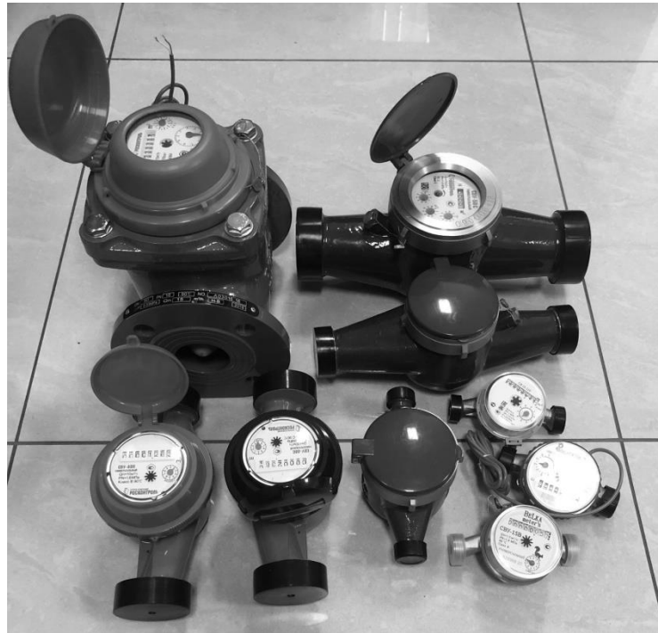
Рисунок 1 - Общий вид счетчиков