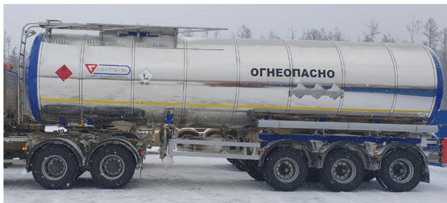
Рисунок 3 – Общий вид полуприцепов-цистерн SF3B38

Общий вид полуприцепов-цистерн SF3B38 зав. №№ X8ASF3B38K0000309, X8ASF3B38K0000758 представлен на рисунке 3.