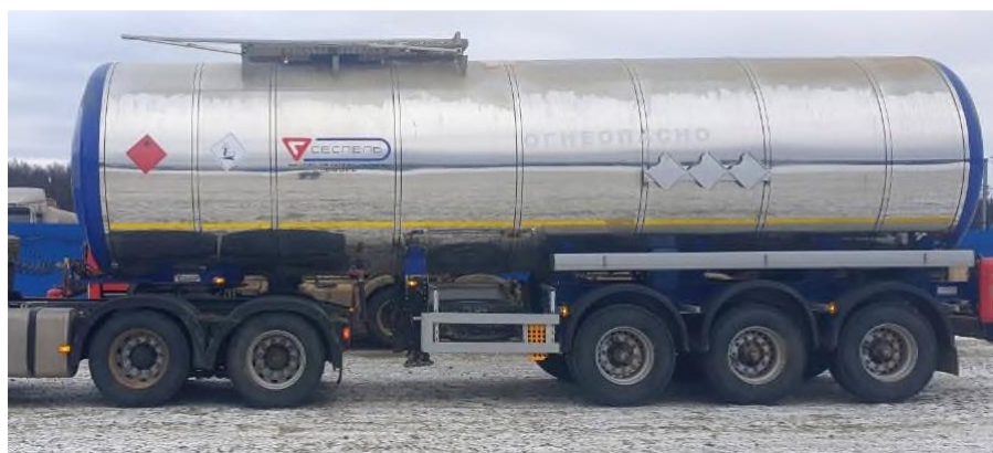
Рисунок 2 – Общий вид полуприцепов-цистерн SF3B35

Общий вид полуприцепов-цистерн SF3B35 зав. №№ X8ASF3B35K0001040, X8ASF3B35K0001041 представлен на рисунке 2.