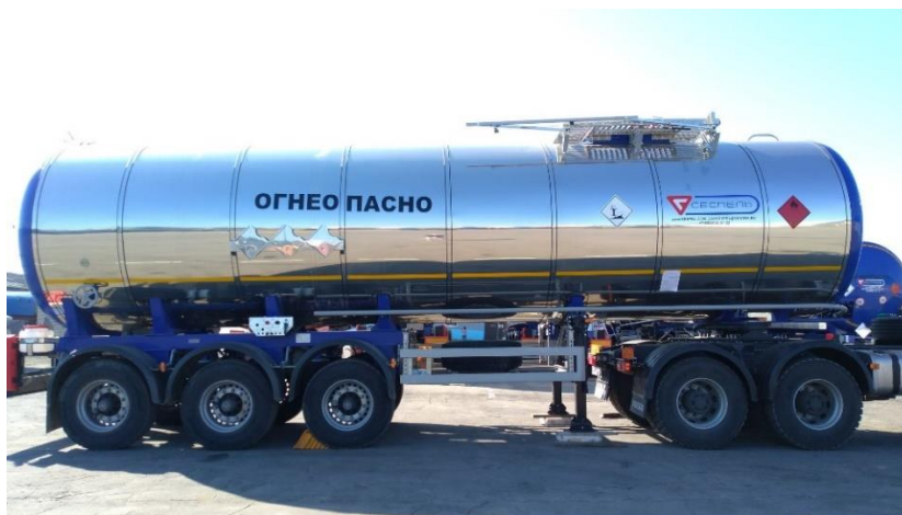
Рисунок 1 – Общий вид полуприцепов-цистерн SF3B32

Общий вид полуприцепов-цистерн SF3B35 зав. №№ X8ASF3B35K0001040, X8ASF3B35K0001041 представлен на рисунке 2.