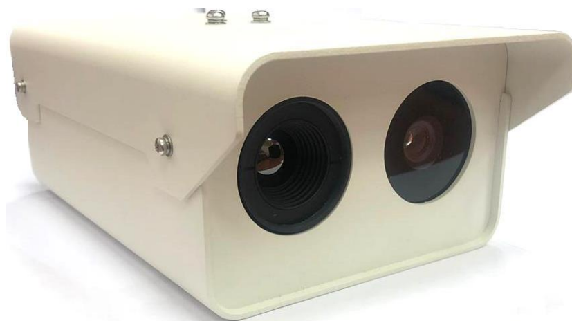
Рисунок 1 - Общий вид оптоэлектронного блока