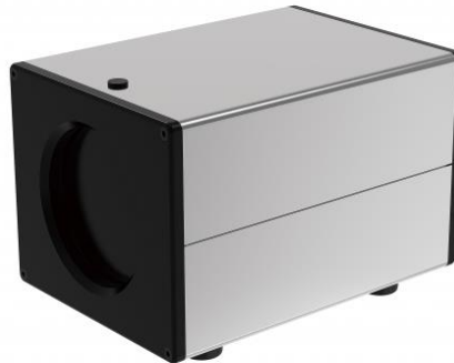
Рисунок 3 – Общий вид АЧТ