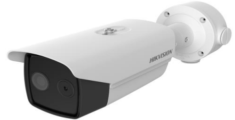
Рисунок 2 – Общий вид опико-электронного блока, входящего в состав комплексов моделей DS-2TD2636B-10/P, DS-2TD2636B-13/P, DS-2TD2636B-15/P, DS-2TD2637B-10/P, DS-2TD2617B-6/PA, DS-2TD2617B-3/PA