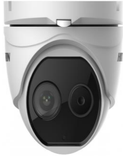
Рисунок 1 – Общий вид опико-электронного блока, входящего в состав комплексов моделей DS-2TD1217B-3/PA, DS-2TD1217B-6/PA

Фотографии общего вида компонентов комплексов тепловизионного контроля измерительных стационарных серии DS-2TD приведены на рисунках 1-3. Структура системы представлена на рисунке 4.