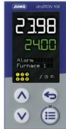
Регулятор diraTRON 108 H тип 702112