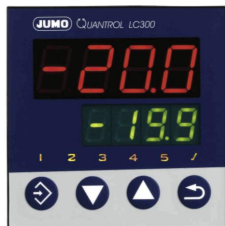
Регулятор JUMO Quantrol LC300