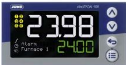
Регулятор diraTRON 108 (Q) тип 702113