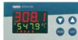
Регулятор dTRON 308Q тип 703043