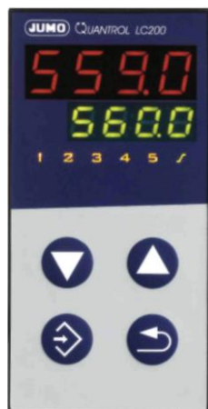
Регулятор JUMO Quantrol LC200