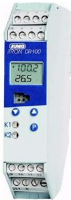
Регуляторы iTROND R 100 тип 702060