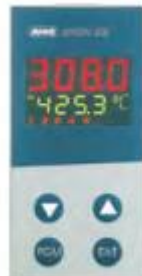
Регулятор dTRON 308H тип 703042