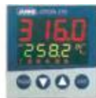
Регулятор dTRON 316 тип 703041