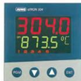
Регулятор dTRON 304 тип 703044