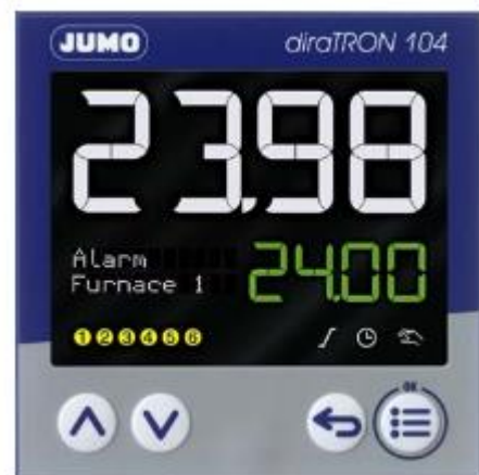
Регулятор diraTRON 104 тип 702114