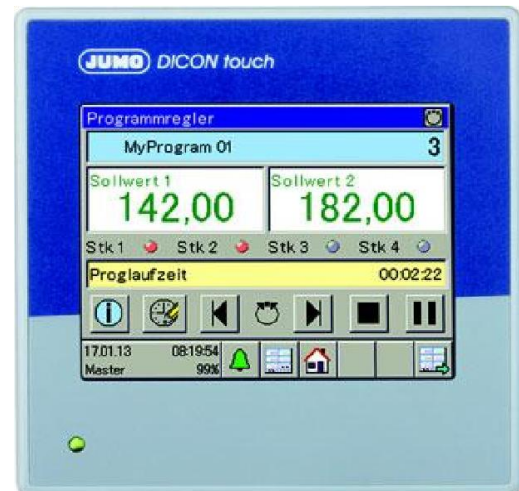
Регулятор DICON touch тип 703571