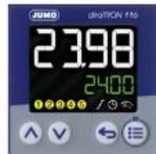
Регулятор diraTRON 116 тип 702111