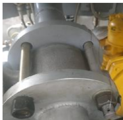
Рисунок 4 – Место пломбирования крана шарового