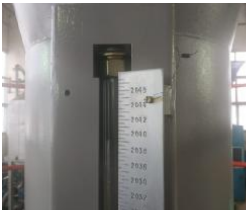
Рисунок 1 – Место пломбирования мерной линейки