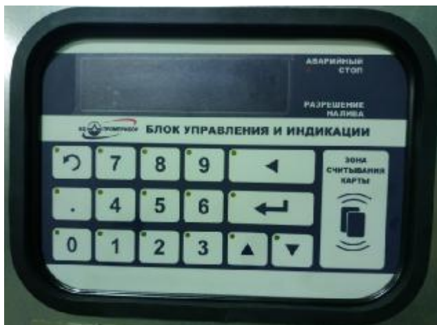
Рисунок 7 – Внешний вид блока управления и индикации БУИ