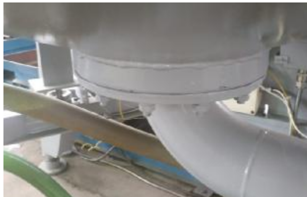
Рисунок 2 – Место пломбирования сливного патрубка