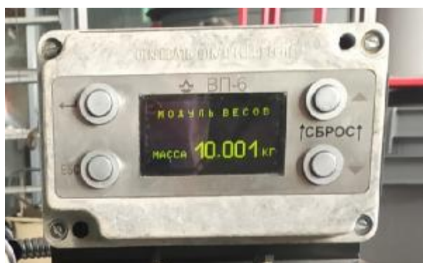
Рисунок 8 – Внешний вид прибора вторичного ВП