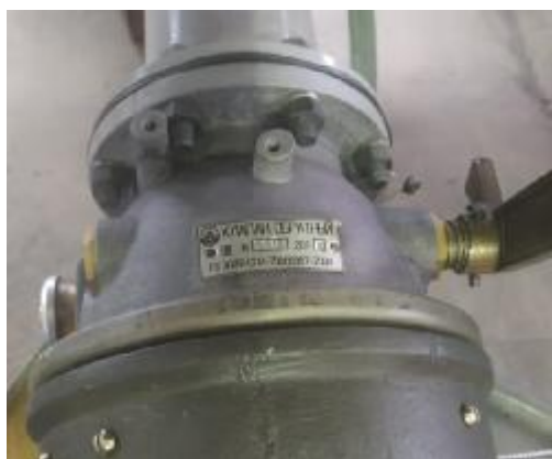
Рисунок 3 – Место пломбирования обратного клапана