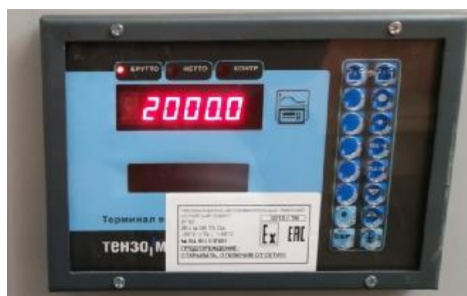
Рисунок 6 – Внешний вид преобразователя весоизмерительного ТВ