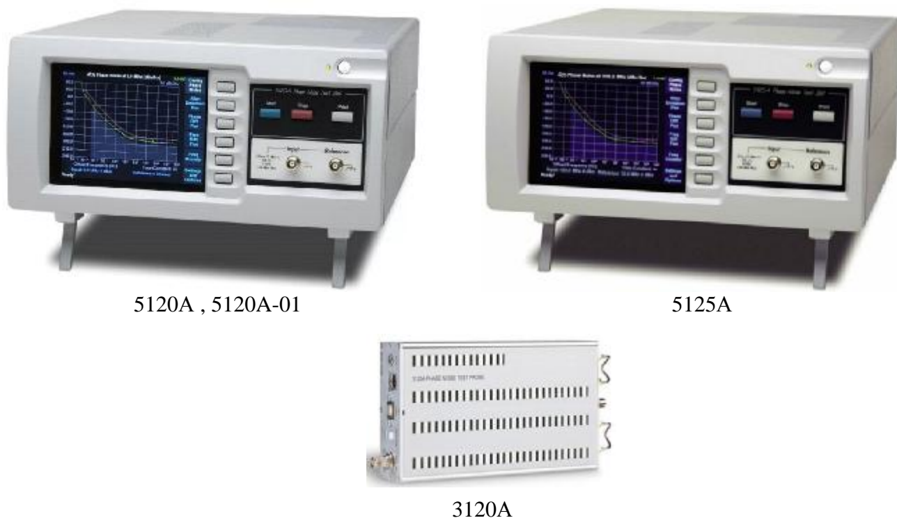
Рисунок 1 – Общий вид АФШ

Схема пломбировки от несанкционированного доступа, обозначение места нанесения знака поверки представлены на рисунке 2.