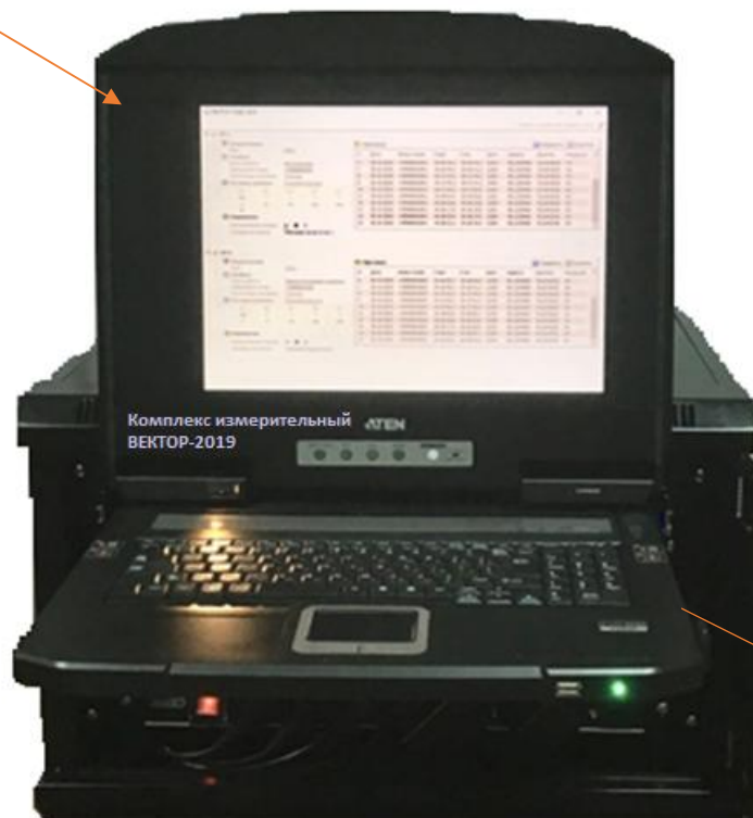
Внешний вид размещения БУК комплексов в стойке (19 дюймов)