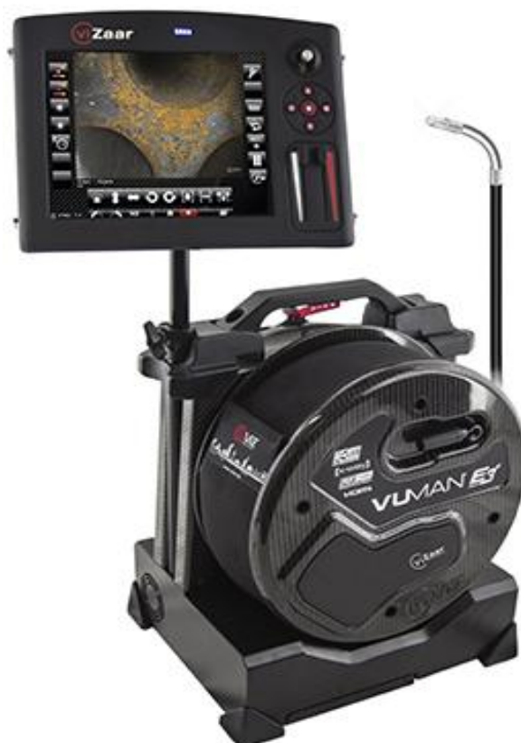
Рисунок 1 - Общий вид средства измерений

Схема пломбировки от несанкционированного доступа, обозначение места нанесения знака поверки представлены на рисунке 2.