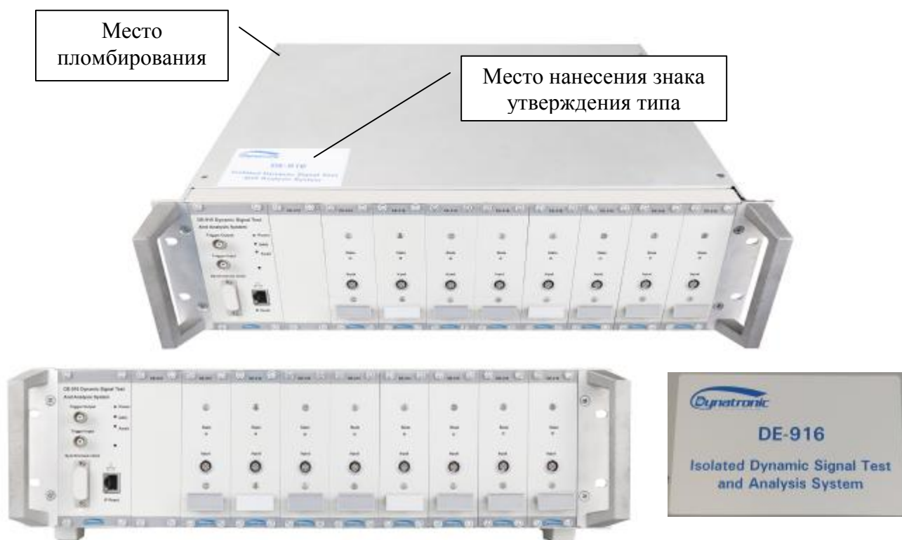
Рисунок 1 - Общий вид комплексов измерительно-вычислительных для мониторинга работающих механизмов модификаций DE-916 и DE-918