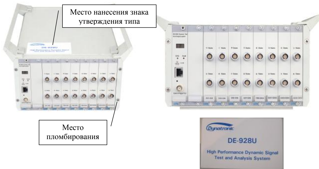
Рисунок 4 - Общий вид комплексов измерительно-вычислительных для мониторинга работающих механизмов модификации DE-928U