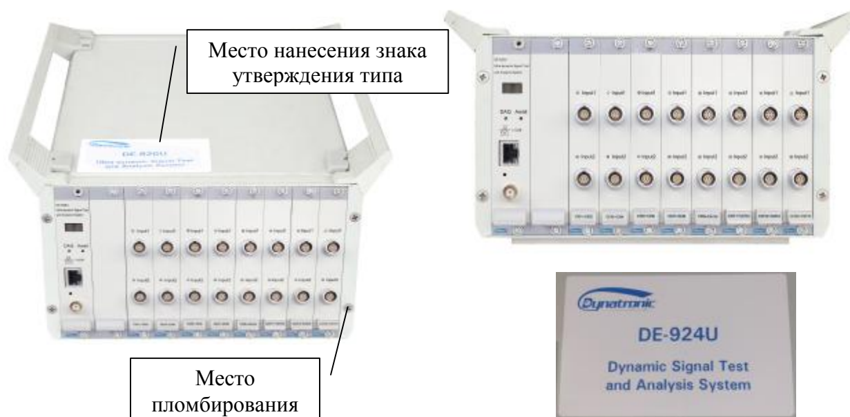
Рисунок 3 - Общий вид комплексов измерительно-вычислительных для мониторинга работающих механизмов модификаций DE-924U и DE-926U