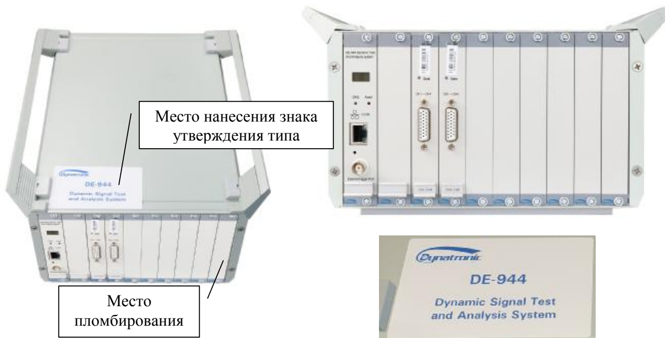
Рисунок 5 - Общий вид комплексов измерительно-вычислительных для мониторинга работающих механизмов модификации DE-944