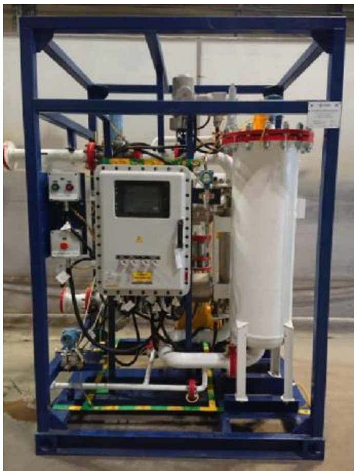
Рисунок 1 – Общий вид установок

Общий вид установок представлен на рисунках 1 и 2. Цвет, габаритные размеры и взаимное расположение элементов конструкции могут отличаться в соответствии с конструкторской документацией.