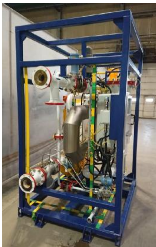
Рисунок 2 – Общий вид установок

Пломбировка установок осуществляется с помощью свинцовой (пластмассовой) пломбы и проволоки, которой пломбируется фланцевые соединения средства измерений массы, объема и плотности жидкости установки, с нанесением знака поверки на пломбу. Средства измерений температуры и давления измеряемой среды, контроллеры измерительные пломбируются в соответствии с описанием типа на конкретное средство измерений. Места пломбирования фланцевых соединений средства измерений массы, объема и плотности жидкости установки приведены на рисунке 3.