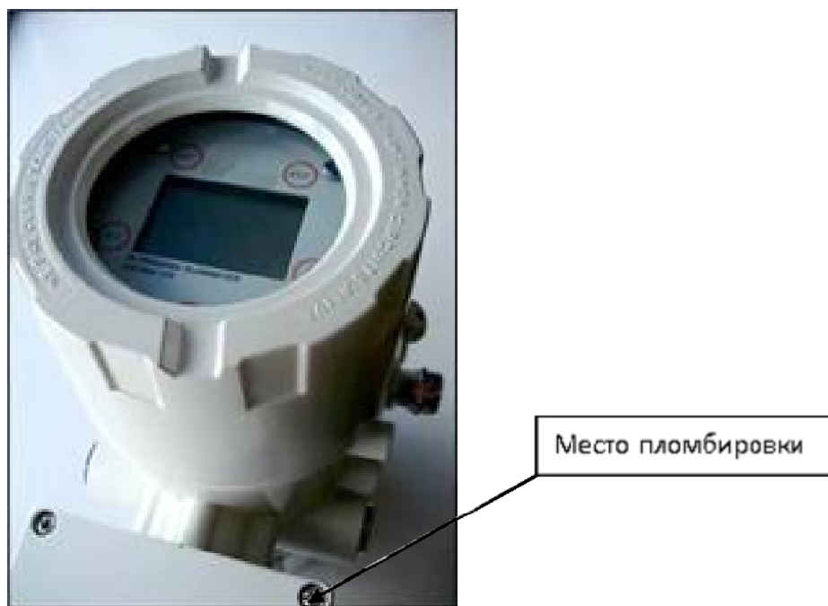
Рисунок 4 – Внешний вид и схема пломбировки вторичного преобразователя расходомера газа ультразвукового «Руна УНЛ-260-ВП-Exde»