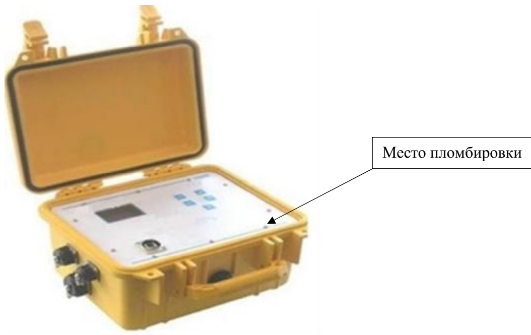
Рисунок 2 – Внешний вид и схема пломбировки вторичного преобразователя расходомера газа ультразвукового «Руна УНЛ-260-ВП-Ext»