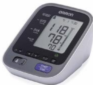
Рисунок 1 – Общий вид OMRON M7 Intelli IT (HEM-7322T-E)

Общий вид и место нанесения защитной наклейки от несанкционированного доступа измерителей артериального давления и частоты пульса автоматических OMRON M7 Intelli IT (HEM-7322T-E) представлены на рисунках 1 – 2.