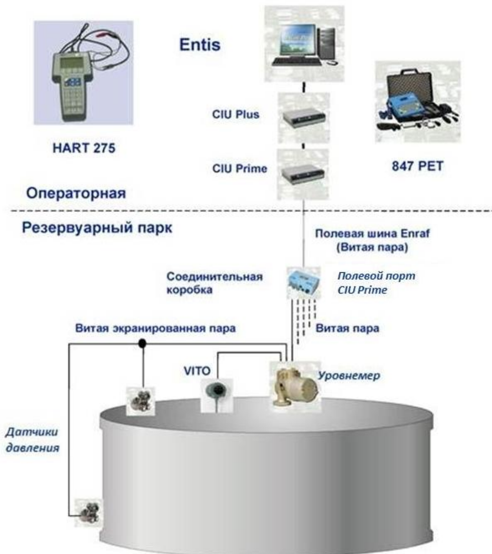
Рисунок 1 – Схема Системы коммерческого учета и контроля резервуарных запасов парков товарных нефтепродуктов Entis- т.910-02-04

Общий вид устройств интерфейсов связи CIU 880 Prime/Plus представлен на рисунке 2.