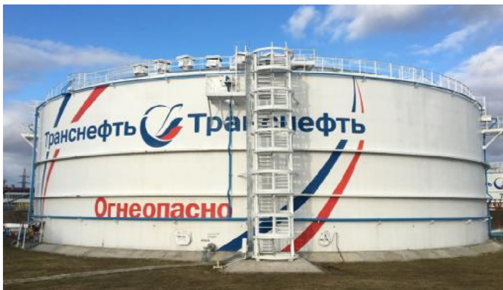
Рисунок 1 – Общий вид резервуаров РВС-20000 зав.№№ 1, 2

Общий вид резервуаров вертикальных стальных цилиндрических РВС-20000 зав.№№ 1, 2, РВСП-20000 зав.№№ 3, 4, 8, 12, 13, 14, 15, 16, 17, 18 представлен на рисунках 1 - 2.