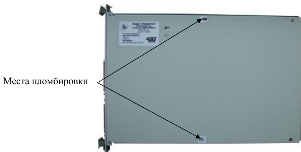
Рисунок 4 – Общий вид схемы пломбировки от несанкционированного доступа