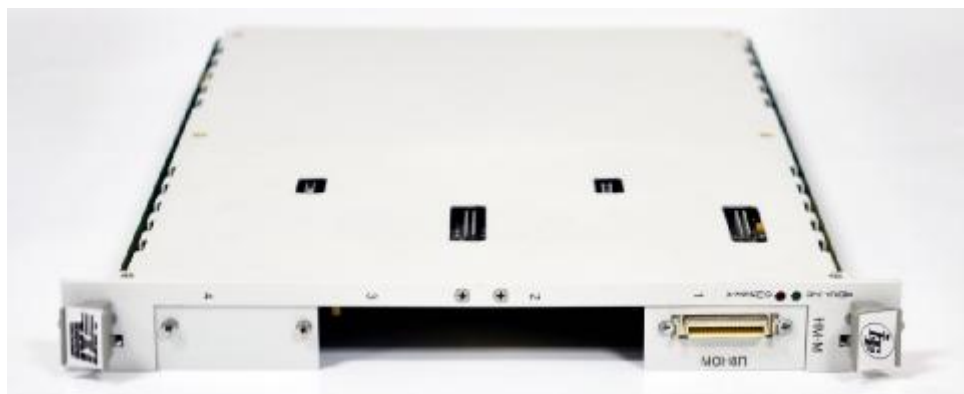
Рисунок 2 – Внешний вид носителя мезонинных модулей типа НМ-М (НМ-У) с установленным МОН8П