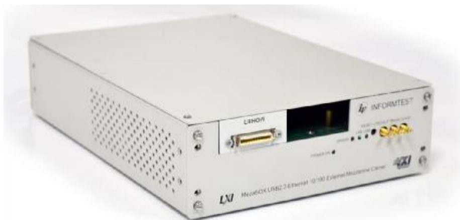
Рисунок 3 – Внешний вид устройства MezaBOX с установленным МОН8П