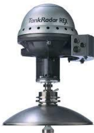
Рисунок 1 – Общий вид уровнемеров

Общий вид уровнемеров представлен на рисунке 1.