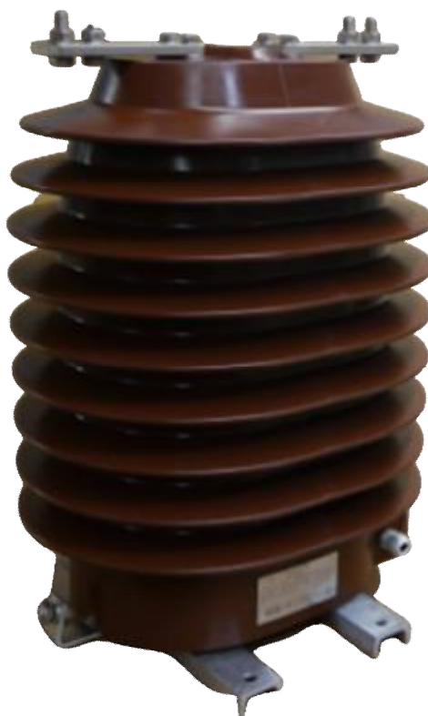
Рисунок 4 – Общий вид трансформаторов тока GИF 40,5-0