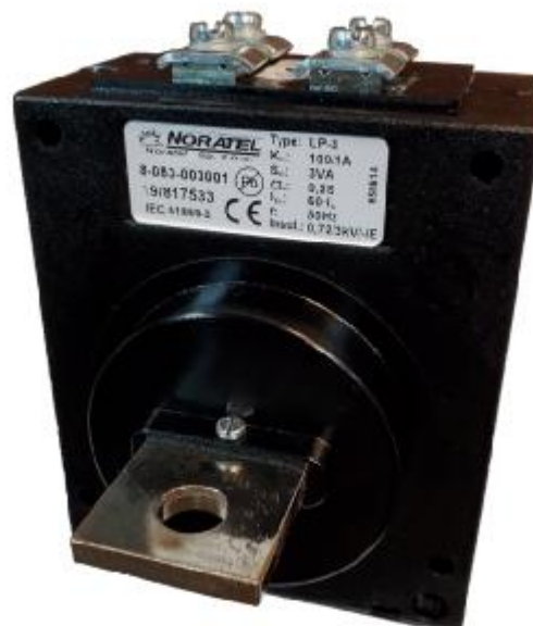
Рисунок 1 - Общий вид трансформаторов тока LP-3

Место пломбировки трансформаторов представлено на рисунке 2.