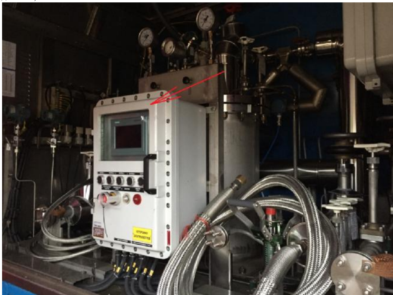
Рисунок 1 – Общий вид комплекса КИ СПГ-ГСК встроенного в гидравлическую схему мобильной криогенной газозаправочной установки

На рисунке 1 показано место нанесения знака поверки на лицевой панели защитного корпуса ЭБУ комплекса. На рисунке 2 показано место пломбирования в целях предотвращения несанкционированного изменения настроек (пломбируется ЭБУ, расположенный под крышкой дисплея).