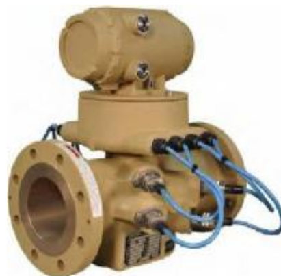
Рисунок 1 – Общий вид УПР

Схемы пломбировки от несанкционированного доступа, обозначение мест нанесения знака поверки приведены на рисунке 2.