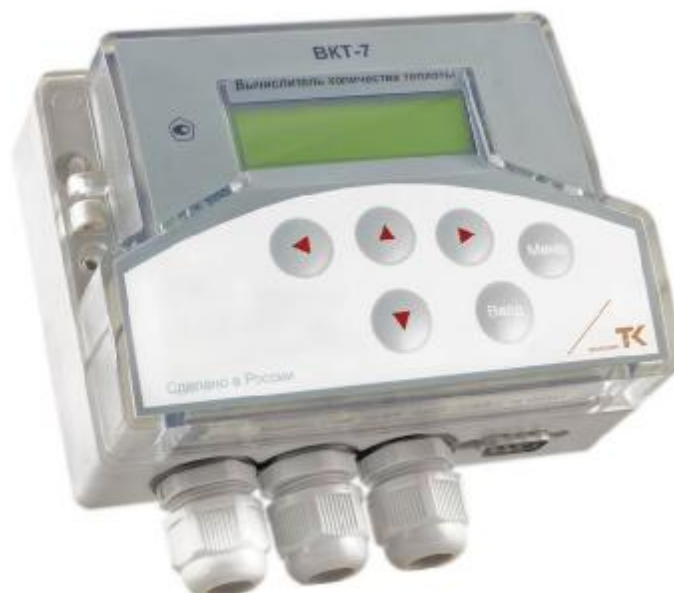
Рисунок 1 – Общий вид вычислителя

Общий вид вычислителя приведен на рисунке 1.