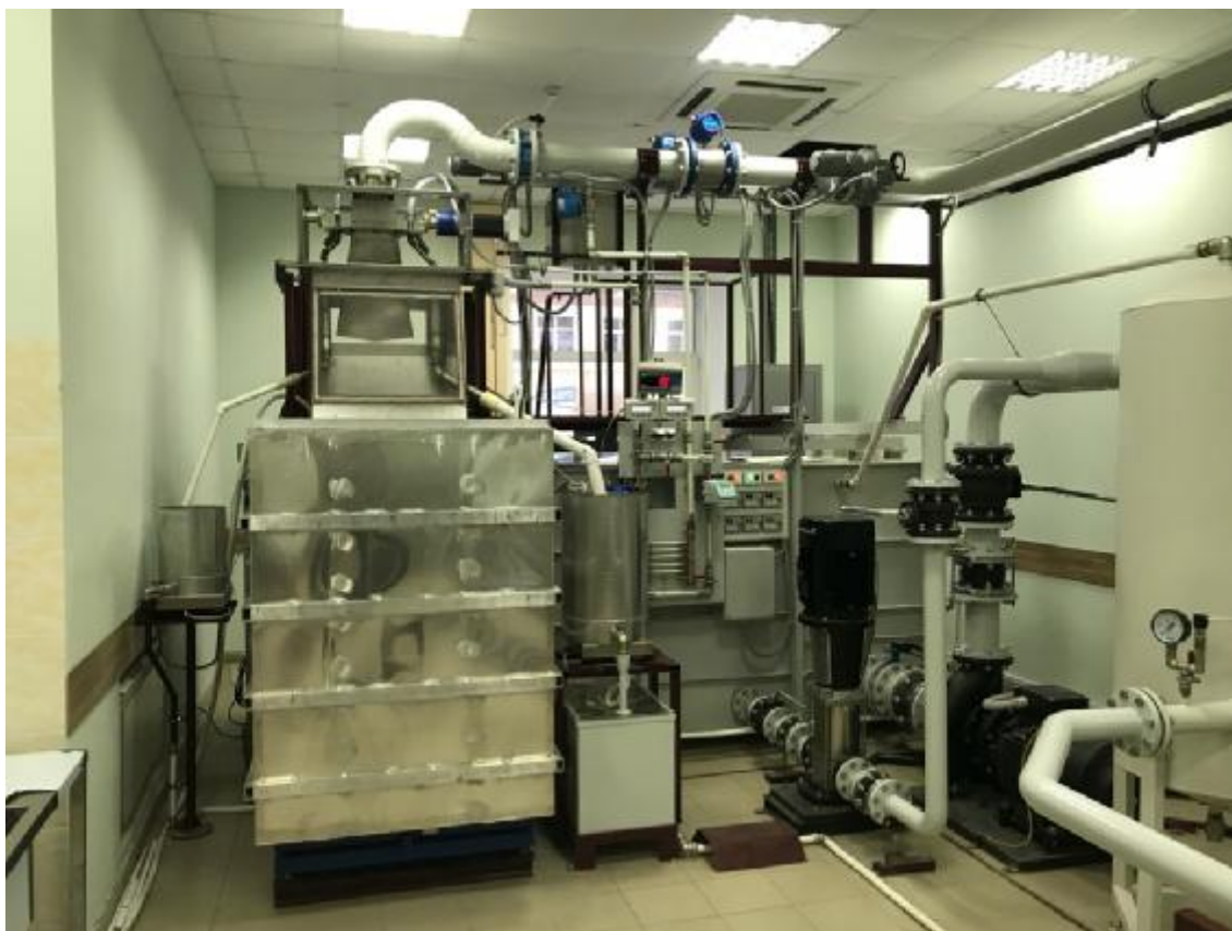
Рисунок 1 – Общий вид установок расходомерных УПРМ-С ТЕПЛОКОМ (место установки средств измерений)