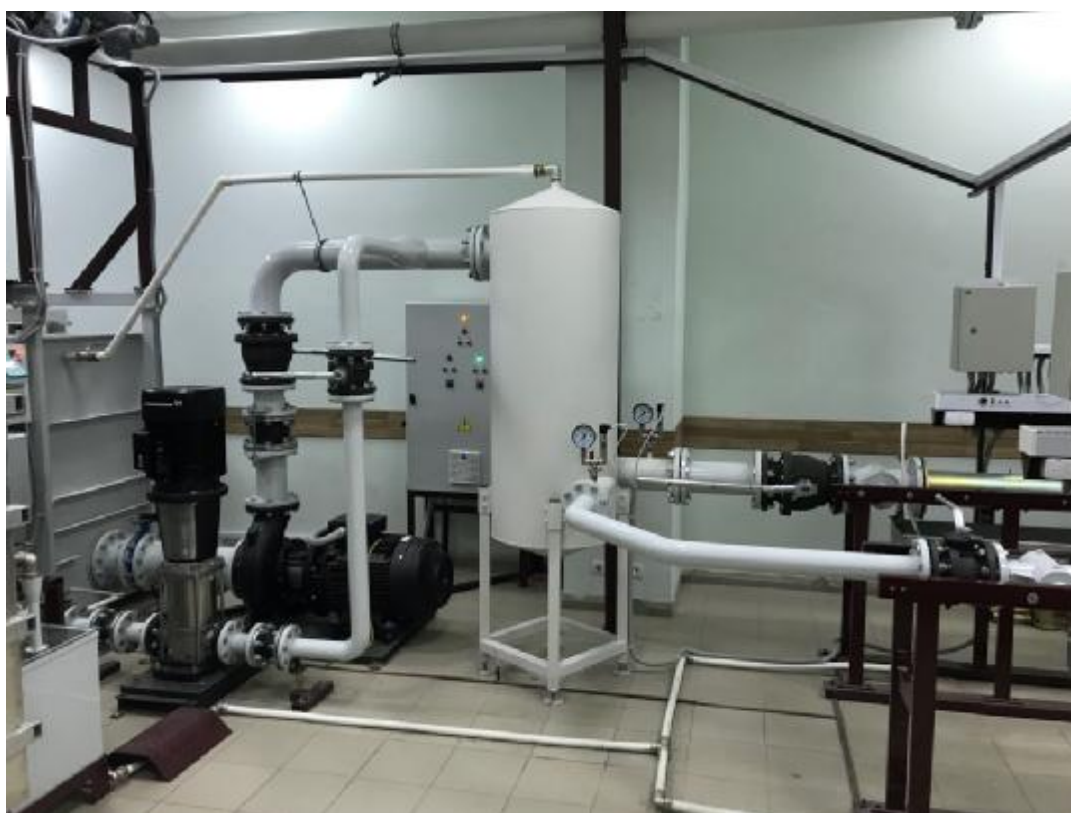
Рисунок 2 – Общий вид установок расходомерных УПРМ-С ТЕПЛОКОМ (насосные агрегаты)