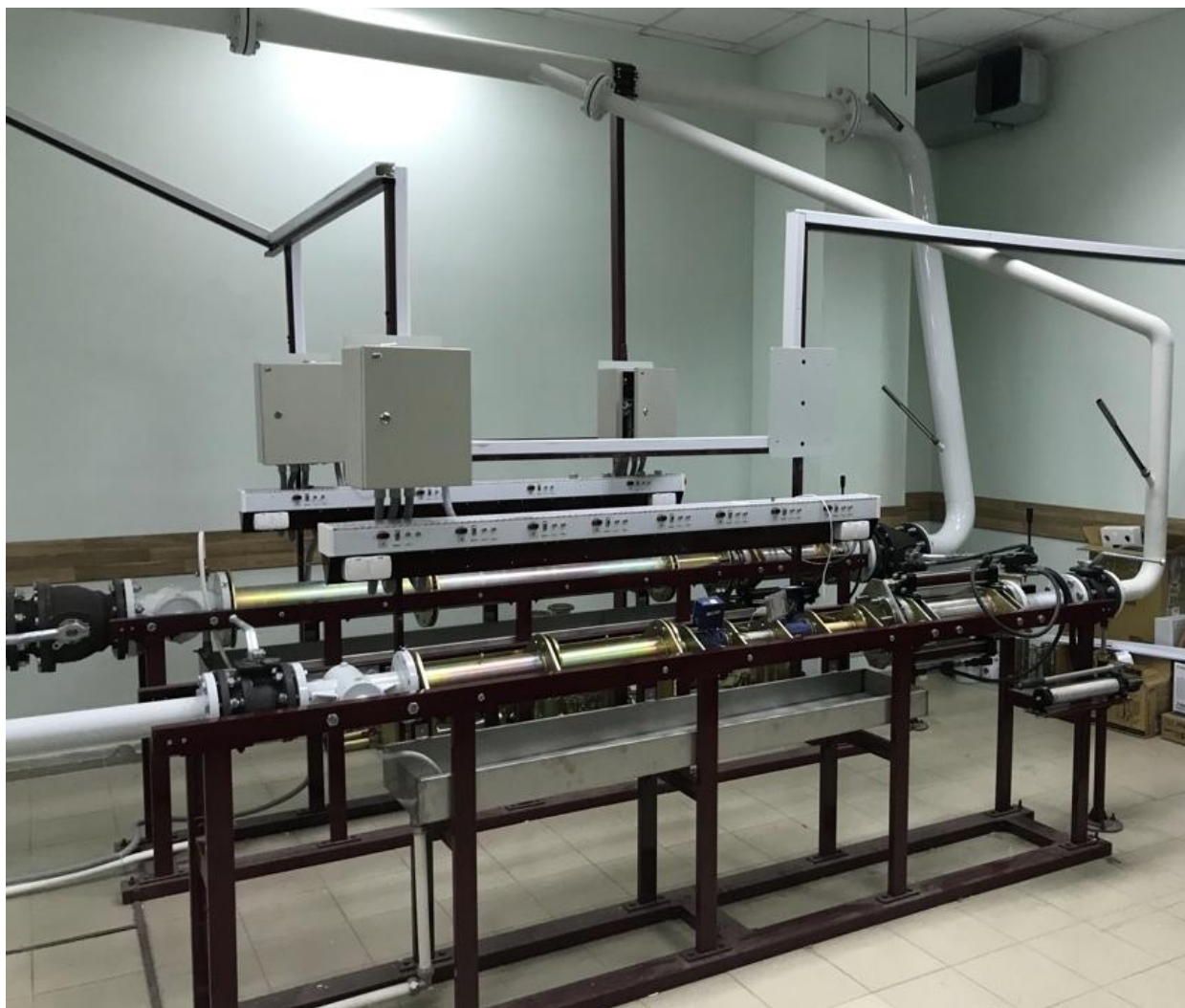
Рисунок 3 – Общий вид установок расходомерных УПРМ-С ТЕПЛОКОМ (измерительные столы)