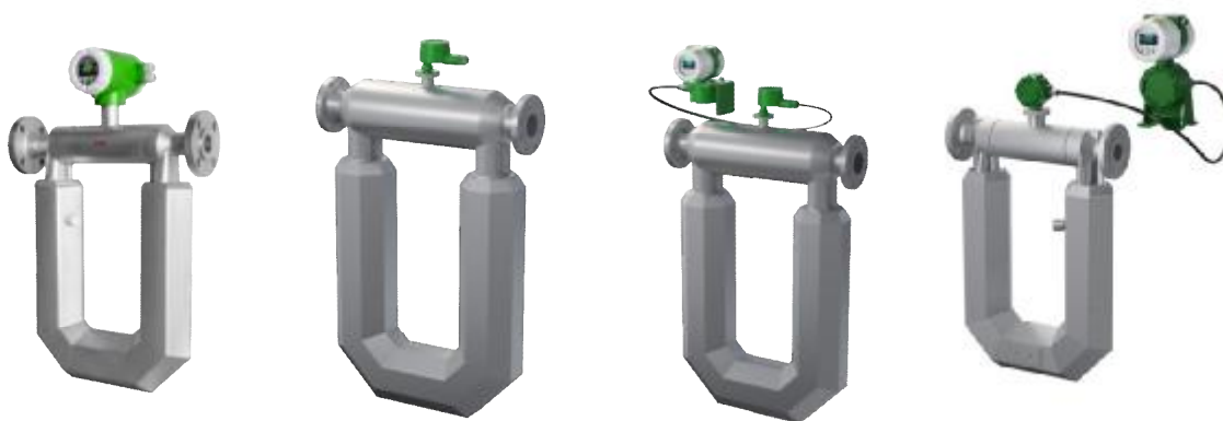
Интегральное исполнение счетчика-расходомера