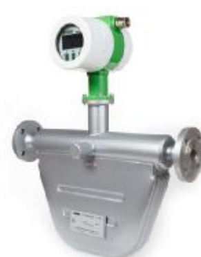
Компактное исполнение счетчика-расходомера от DN 5 до DN 300