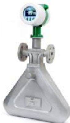
Стандартное исполнение счетчика-расходомера от DN 10 до DN 15