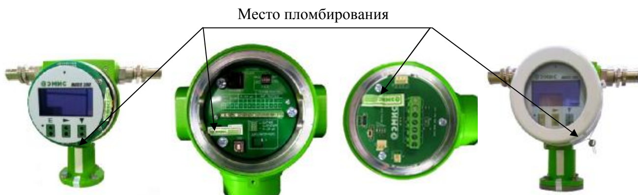
Рисунок 2 – Варианты пломбирования счетчиков-расходомеров, в зависимости от исполнения ЭБ