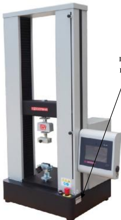
Рисунок 5 – Общий вид машины испытательной марки DVT DEVOTRANS серии GP

место нанесения товарного знака предприятия- изготовителя