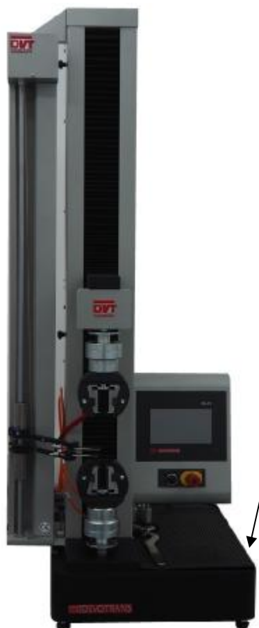
Рисунок 3 – Общий вид машины испытательной марки DVT DEVOTRANS серии BP

место нанесения товарного знака предприятия- изготовителя