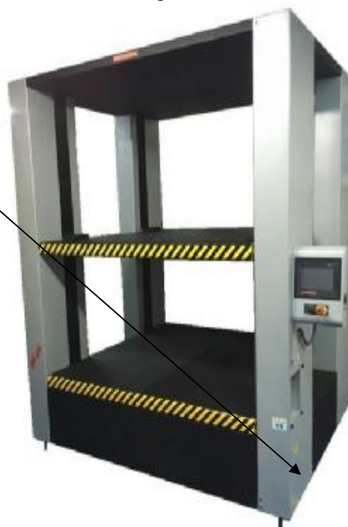
Рисунок 6 – Общий вид машины испытательной марки DVT DEVOTRANS серии S6

место нанесения товарного знака предприятия- изготовителя