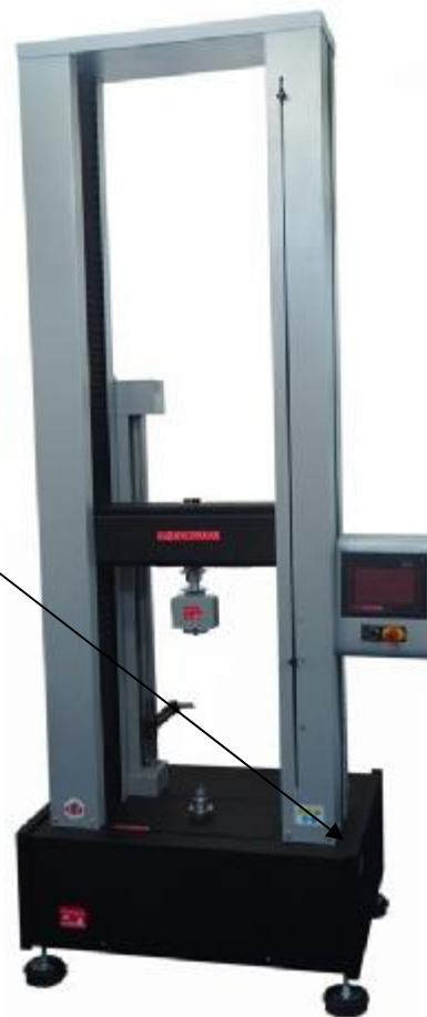
Рисунок 4 – Общий вид машины испытательной марки DVT DEVOTRANS серии FU

место нанесения товарного знака предприятия- изготовителя