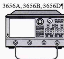
Рисунок 6 - Схема подключения полной двухпортовой калибровки

8.8.2 Подготовить векторный анализатор для проверки эффективных характеристик коэффициента отражения и передачи путем выполнения полной двух портовой калибровки, последовательным нажатием клавиш: