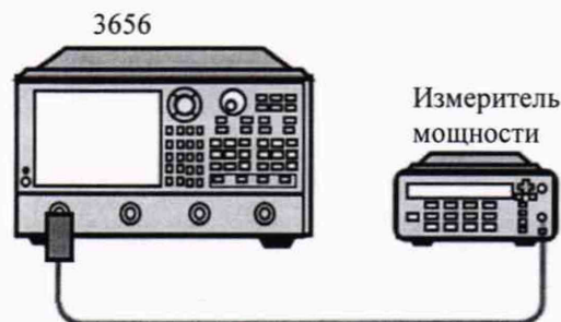
Рисунок 2 - Схема подключения измерителя мощности для проверки диапазона регулировки мощности.

8.5.2 Соединить оборудование в соответствии с рисунком 2.