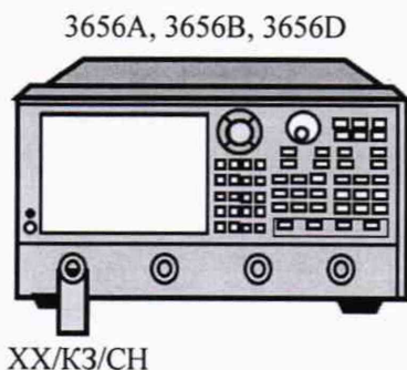
Рисунок 7 - Проверка трекинга отслеживания

8.8.16 Проверка эффективных характеристик передаточных характеристики порта, для этого выполнить полную однопортовую калибровку.