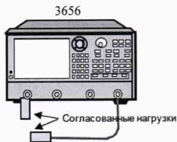
Рисунок 4 - Проверка уровня собственных шумов приемника

8.7.2 Установите настройки путем последовательного нажатия клавиш