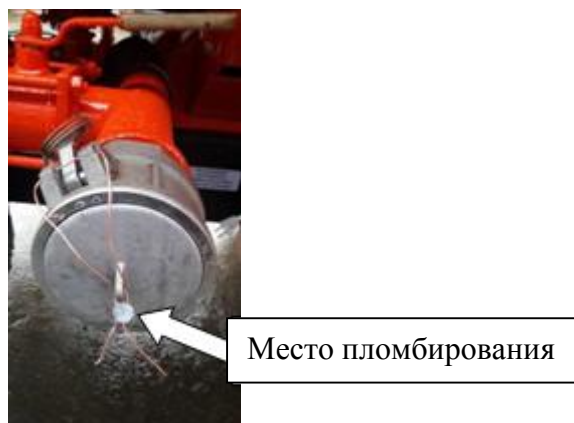
Рисунок 2 – Пломбировка трубопровода слива-налива