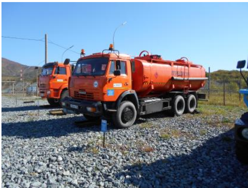
Рисунок 1 – Автоцистерна для жидких нефтепродуктов 4649А2-10

Общий вид ТМ представлен на рисунке 1. Места пломбирования от несанкционированного доступа показаны на рисунках 2, 3.