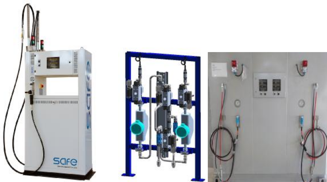
Модификации ESP и ESPH

В установках предусмотрено опломбирование счётчика-расходомера массового Micro Motion, модификации CNG050, и защитной крышки контроллера CPTH02, схемы пломбирования представлены на рисунках 2 и 3 соответственно.