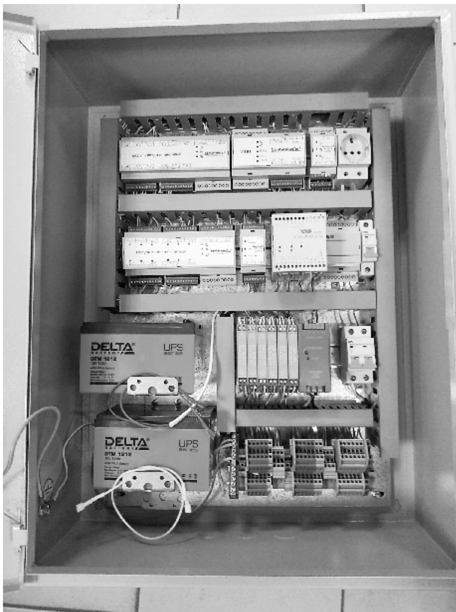
в) шкаф телеизмерений и телесигнализаций