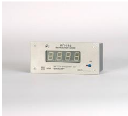
Рисунок 6 - Выносной индикатор ИП-115

Схема пломбировки от несанкционированного доступа представлена на рисунке 7.