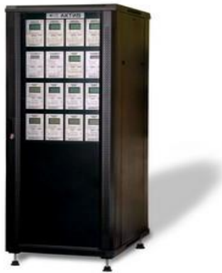
Рисунок 1 Общий вид аппаратуры «АКТИВ»

* Выносной индикатор ИП-115 применяется только для канала измерения и контроля канала частоты вращения.