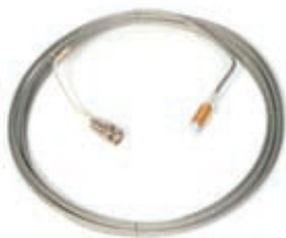
Датчик ИП-106, ИП-116