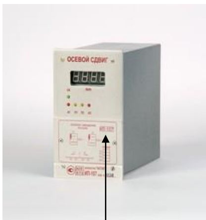
а) Блоков контроля

Схема пломбировки от несанкционированного доступа представлена на рисунке 7.