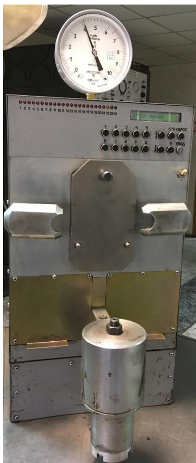
а) исполнения УКАР-2М, УКАР-2М-4