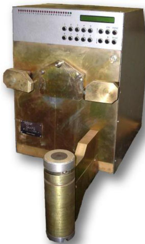
б) исполнение УКАРД