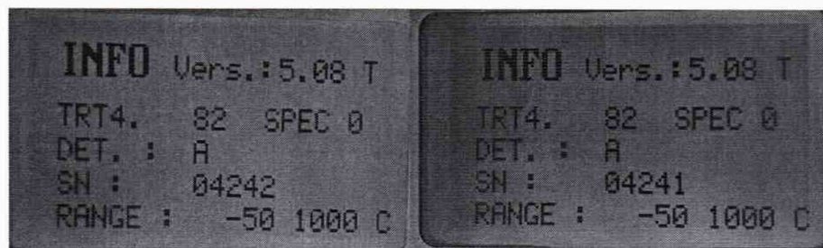
Рисунок 1- Идентификационное наименование встроенного ПО

4.3.1 Определение идентификационного наименования встроенного ПО СИ проводится в соответствующем разделе меню Info, в котором приведены сведения о приборе, его зав. номере и версии ПО.