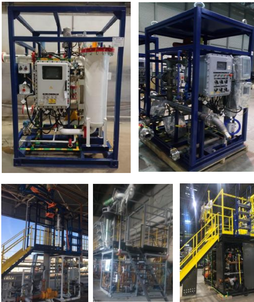
Рисунок 1 – Общий вид установок измерительных «ОЗНА-Агидель»

Общий вид установок представлен на рисунке 1.