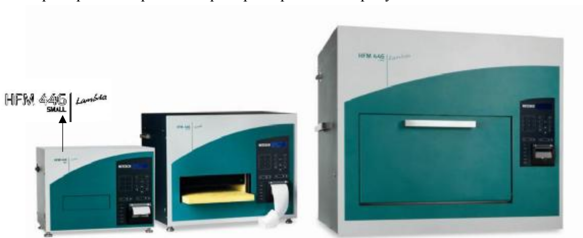
Рисунок 1 - Общий вид приборов HFM 446 Lambda (слева направо Small, Medium, Large)

Пример пломбирования приборов приведен на рисунке 2.