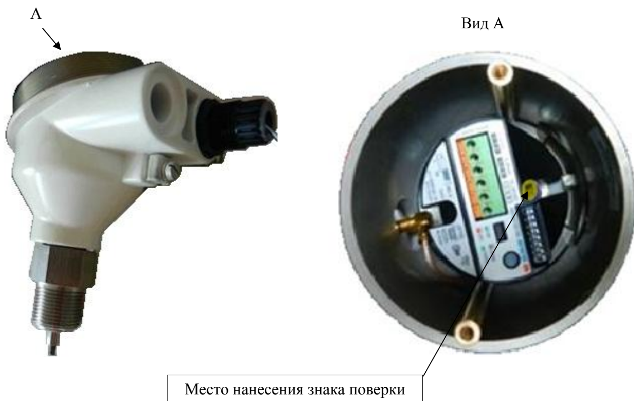
б) схема пломбирования уровнемера без показывающего устройства