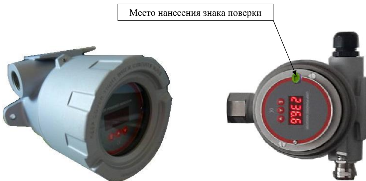
а) схема пломбирования уровнемера с показывающим устройством