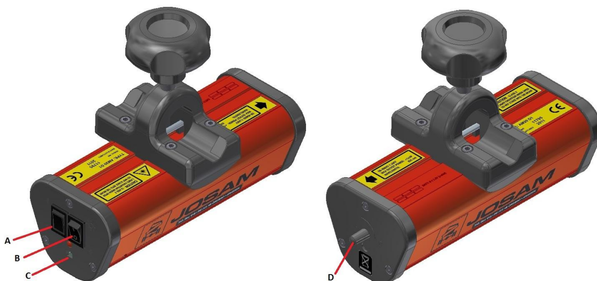
Рисунок 1 – Общий вид лазерных проекторов

Общий вид устройств представлен на рисунках 2 и 3.