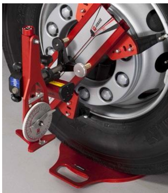
Рисунок 2 - Общий вид стенов для регулировки установки колес автомобилей серии Laser AM, модели AM BASIC K

Общий вид устройств представлен на рисунках 2 и 3.