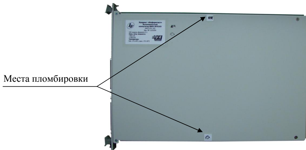
Рисунок 2 – Схема пломбировки от несанкционированного доступа функциональных модулей систем