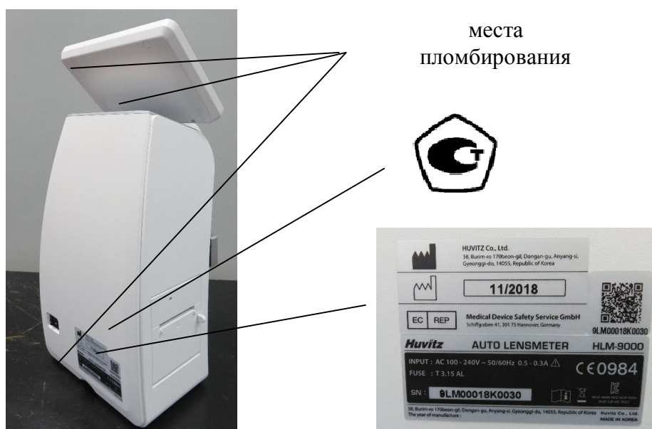
с) модель HLM-9000