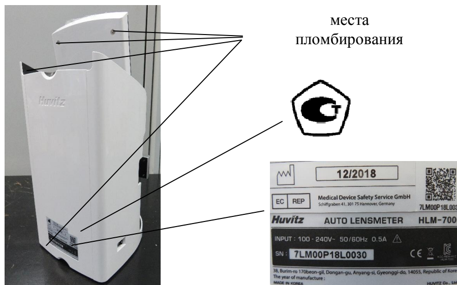
б) модель HLM-7000