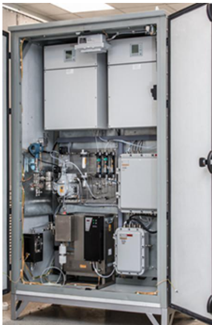
Рисунок 2 – Общий вид внутри обогреваемого шкафа с элементами системы

Общий вид внутри шкафа с элементами системы приведен на рисунке 2.