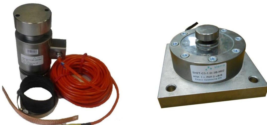
а) семейство Column (модификация SBM14) б) семейство Spoke type (модификация SH2)