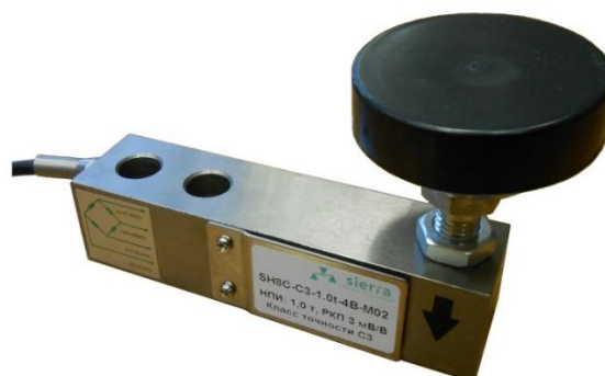
Рисунок 2 – Общий вид датчиков семейства Single shear beam (модификация SH8)