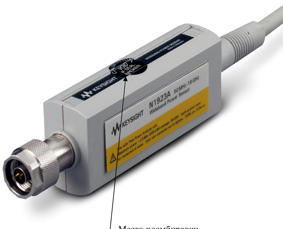
Место пломбировки Рисунок 2 – Схема пломбировки от несанкционированного доступа преобразователей измерительных

Схема пломбировки от несанкционированного доступа преобразователей измерительных представлена на рисунке 2.