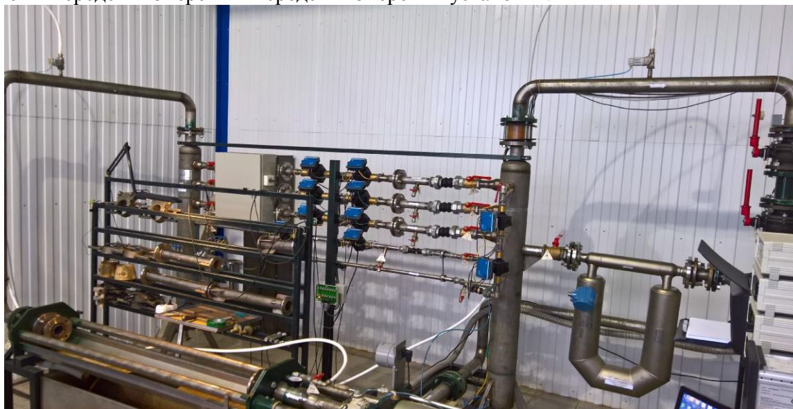
Рисунок 1 – Общий вид установки поверочной СПРУТ 50М

Поверяемое средство измерений устанавливается в измерительную линию установки, состоящей из зажимного устройства, запорной арматуры, средств измерений массового и объемного расхода жидкости, массы и объема жидкости в потоке, давления и температуры измеряемой среды. Рабочая жидкость подается насосом из накопительного резервуара в гидравлический тракт рабочего контура установки, проходит через измерительную линию и расходомеры установки. Далее, рабочая жидкость направляется обратно в накопительный резервуар. Измерительно-вычислительный комплекс управляет работой установки, в автоматическом режиме собирает, обрабатывает и сравнивает полученные показания поверяемых средств измерений и средств измерений установки.