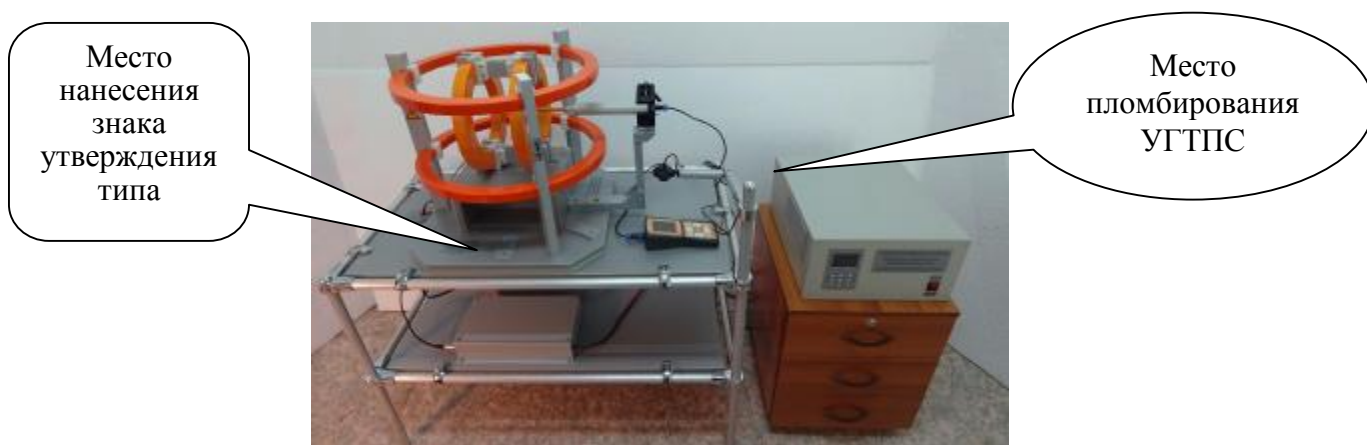
Рисунок 1 - Общий вид установок