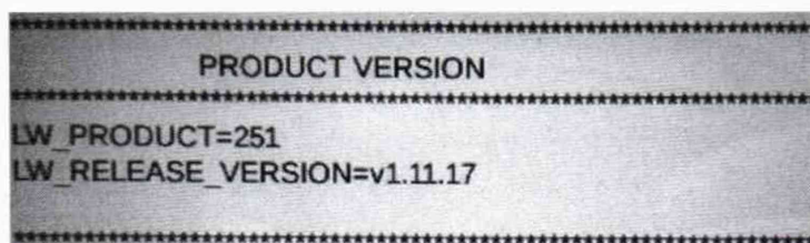
Рисунок 1 — Идентификация ПО

Номер версии ПО отображается на дисплее толщиномера во вкладке «Info» ПО (рисунок 1).